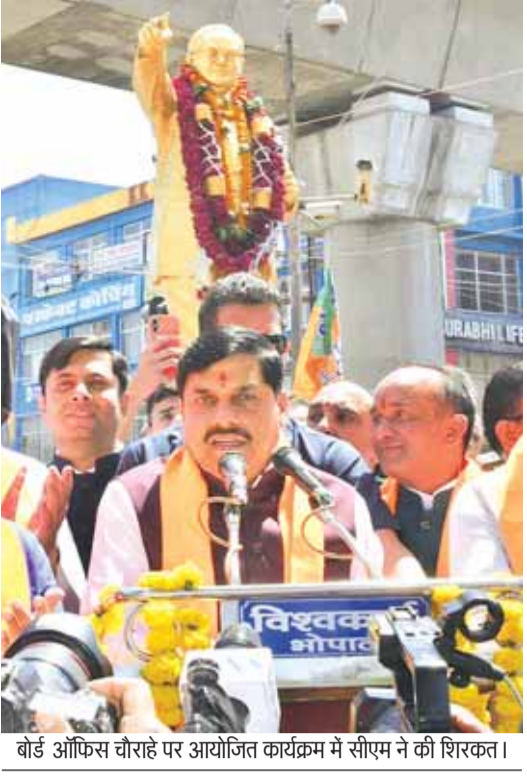
बोर्ड ऑफिस चौराहे पर आयोजित कार्यक्रम में सीएम ने की शिरकत।