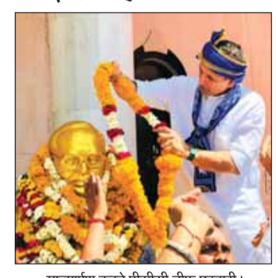
माल्यार्पण करते पीसीसी चीफ पटवारी।

मध्यप्रदेश कांग्रेस कमेटी के अध्यक्ष पटवारी ने भारत रत्न डॉ. भीमराव आंबेडकर की जयंती के अवसर पर उनकी जन्मस्थली डॉ. आंबेडकर नगर (महू) पहुंचकर श्रद्धा-सुमन अर्पित किए और उन्हें सादर नमन किया। इस अवसर पर पटवारी ने कहा कि बाबा साहेब के विचार लोकतंत्र की मजबूती, समान अधिकार, सामाजिक न्याय और संविधान की रक्षा के लिए सदैव प्रेरणा देते रहेंगे। उन्होंने कहा कि हर वर्ग की भागीदारी और समानता का मार्ग ही बाबा साहेब का सच्चा सपना था। इसके पश्चात विधायक आतिफ अकोल द्वारा आयोजित बाबा साहेब की प्रतिमा स्थापना एवं अनावरण कार्यक्रम में शामिल हुए। इस कार्यक्रम में भोपाल उत्तर विधानसभा के विधायक आतिफ अकोल द्वारा बाबा साहेब की प्रतिमा स्थापित की गई, जिसका अनावरण मध्य प्रदेश के पूर्व मुख्यमंत्री दिग्विजय सिंह एवं प्रदेश