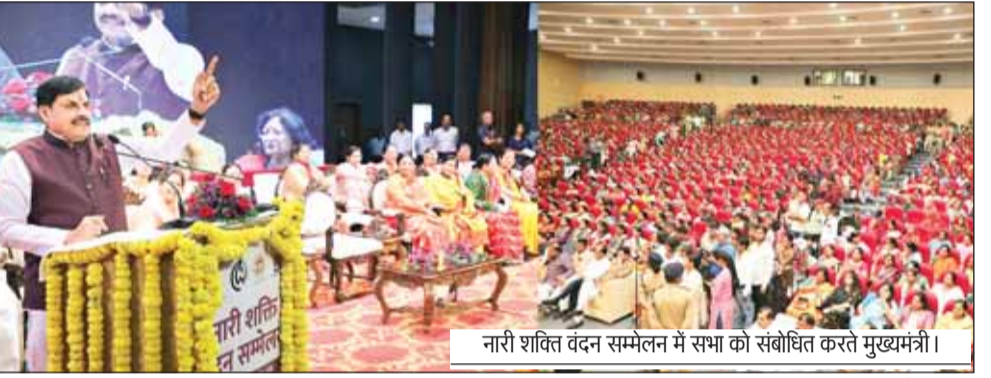
नारी शक्ति वंदन सम्मेलन में सभा को संबोधित करते मुख्यमंत्री।

मुख्यमंत्री डॉ. मोहन यादव ने कहा कि वर्ष 2047 में भारत को विकसित राष्ट्र बनाना है। महिलाओं के हित में लगातार निर्णय लेकर महिलाओं को अधिकार देने के साथ उन्हें सशक्त बना रहे हैं। मुख्यमंत्री ने कहा कि डॉ. आंबेडकर की पहल को आगे बढ़ाते हुए प्रधानमंत्री मोदी ने नारी शक्ति को लोकसभा और विधानसभाओं में 33 प्रतिशत आरक्षण दिलवाने का संकल्प लिया है। यह 21 वीं शताब्दी का सबसे बड़ा निर्णय है। इस अधिनियम के लागू होने के बाद नारी शक्ति का तेजी से सशक्तिकरण होगा। मुख्यमंत्री डॉ. यादव मंगलवार को इंदौर के परस्पर नगर स्थित लता मंगेशकर ऑडिटोरियम में आयोजित नारी शक्ति वंदन सम्मेलन को संबोधित कर रहे थे। उन्होंने कहा कि प्रधानमंत्री ने सुप्रीम कोर्ट के निर्णयों का पालन करते हुए मुस्लिम महिलाओं को तीन तलाक से मुक्ति दिलाकर उनके हित में नया इतिहास लिखा, तो वहीं अयोध्या में भगवान श्रीराम का भव्य मंदिर बनाया। मुख्यमंत्री ने कहा कि इंदौर देवी अहिल्याबाई का शहर है, और स्वर कोकिला लता मंगेशकर की जन्मस्थली है। आज हम जिस सभागृह में उपस्थित हैं वह लता मंगेशकर की स्मृति में बनाया गया है।