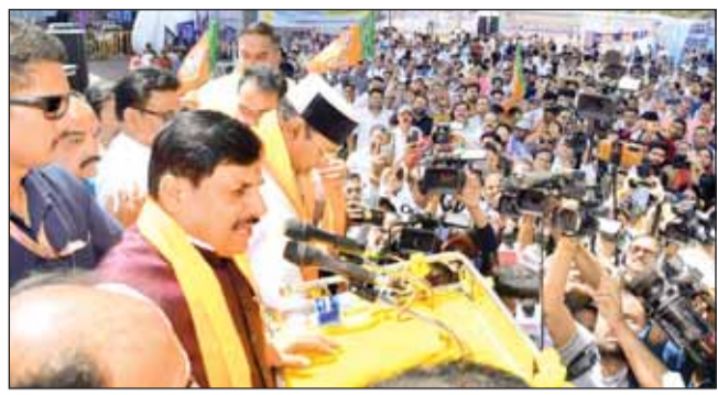
समतामूलक समाज के निर्माण के लिए सभके अधिकारों की सुरक्षा की भारतीय संविधान की रचना कर इसमें मुख्यमंत्री डॉ. यादव ने बाबा साहेब के

सम्मान में पुष्पांजलि कार्यक्रम में मौजूद सबके समक्ष भारतीय संविधान की मूल उद्देश्यिका का वाचन कर 'डॉ. भीमराव आंबेडकर अमर रहे' के नारे लगाए। उन्होंने कहा कि बाबा साहेब डॉ. आंबेडकर आजीवन वंचितों, पीड़ितों, शोषितों और उपेक्षितों के सामाजिक, आर्थिक, शैक्षिक और राजनैतिक सशक्तिकरण की प्रखर आवाज थे। हमारी सरकार संविधान निमाता बाबा साहेब डॉ. आंबेडकर की समरसता और समानता की भावना को केन्द्र में रखकर लगातार काम कर रही है। बाबा साहेब ने हमें समानता का अधिकार दिलाया और अब हम प्रधानमंत्री नरेंद्र मोदी के नेतृत्व में / 'सबका साथ-सबका विकास, सबका विश्वास, सबका प्रयास/' के पथ पर आगे बढ़ते हुए बाबा साहेब के स्वप्न को साकार कर रहे हैं। देश सबसे पहले है, हम सब सामाजिक समरसता के लिए मिल-जुलकर, एकजुट प्रयास करेंगे। मुख्यमंत्री डॉ. यादव ने कहा कि हमारी सरकारों ने हमेशा ही बाबा साहेब का सम्मान किया। भोपाल में उड़ान पुल बना, तो उसे हमने बाबा साहेब का नाम दिया। बाबा साहेब की जन्मभूमि महू में भव्य स्मारक बनवाया।