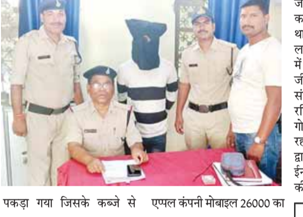
पकड़ा गया जिसके कब्जे से एप्ल कंपनी मोबाइल 26000 का